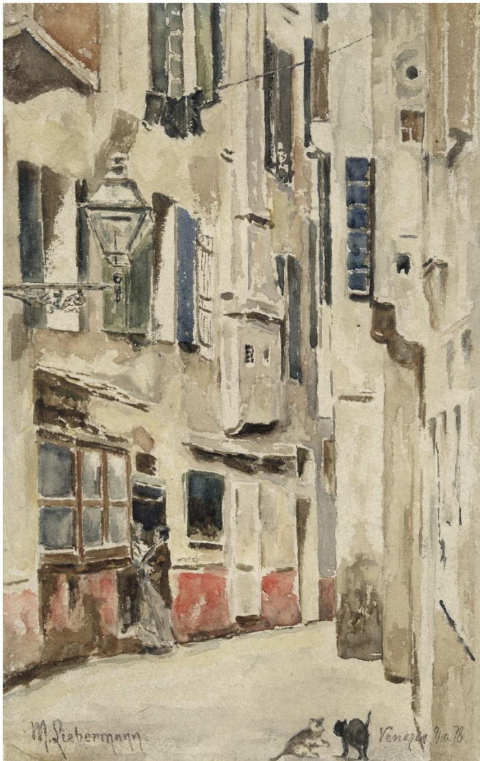
1 – Max Liebermann, Gasse in Venedig, 1878, Aquarell auf Papier, Hamburger Kunsthalle