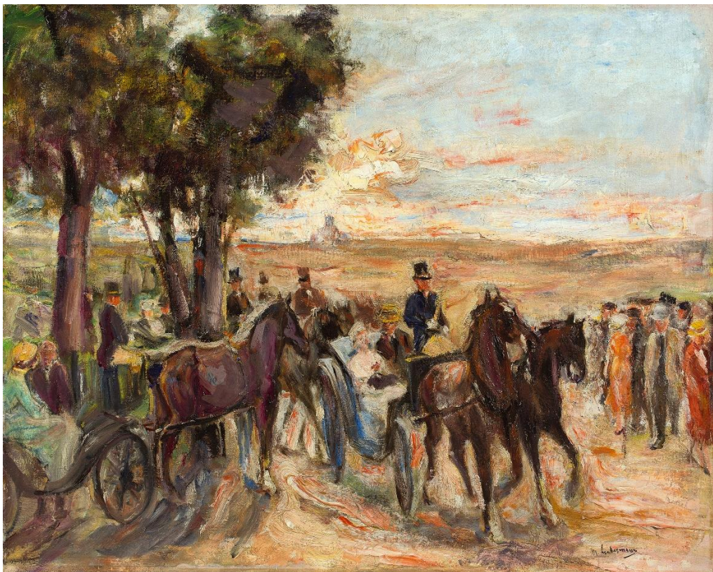
7 – Max Liebermann, Corso auf dem Monte Pincio in Rom, 1930–1932, Öl auf Leinwand, Privatbesitz