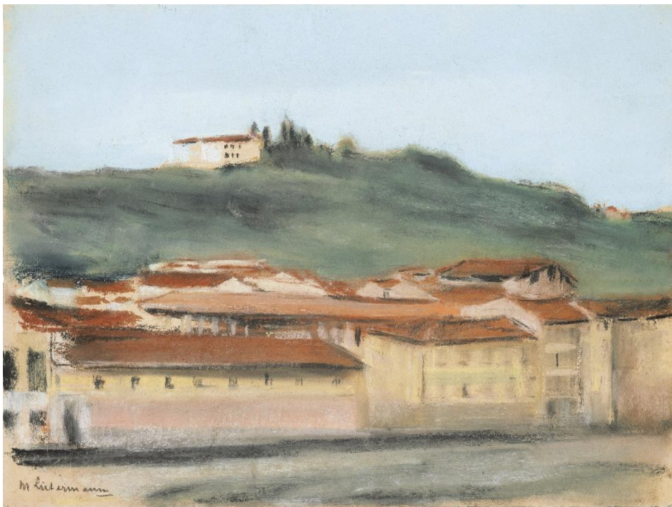
3 – Max Liebermann, Monte Oliveto Florenz (Dächer in Florenz), 1902, Pastell auf Papier, Privatbesitz