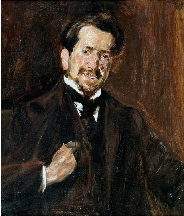
2 – Max Liebermann, Bildnis des Malers Umberto Veruda, 1899 [1898], Öl auf Leinwand, Civico Museo Revoltella - Galleria d'Arte Moderna, Triest