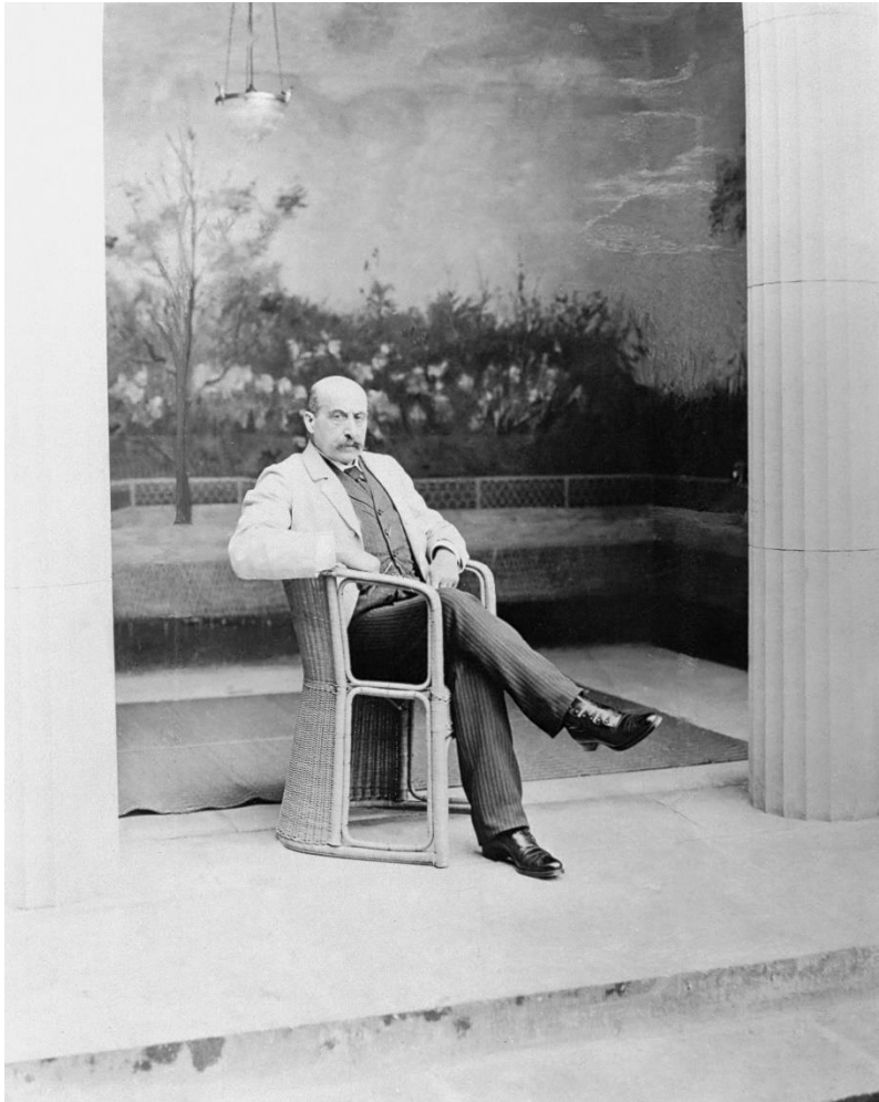
8 – Max Liebermann vor der Loggia seiner Villa, 1914, Max-Liebermann-Gesellschaft Berlin e.V.