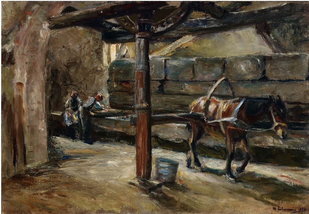
6 – Max Liebermann, Tuchwalke in Florenz, 1893, Öl auf Leinwand, Privatbesitz