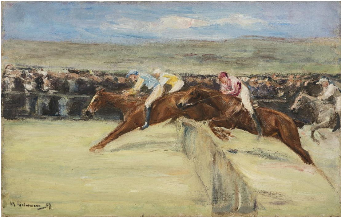
5 – Max Liebermann, Pferderennen in den Cascinen, Studie, 1909, Öl auf Leinwand, Privatbesitz