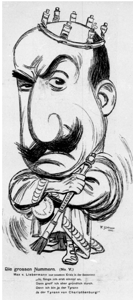
8 – Franz Jüttner, Die grosse Nummern , (No. V.), Max v. Liebermann (zur neusten Krisis in der Sezession), 1902, Reproduktion, aus: Lustige Blätter , 1902, Nr. 9, S. 9