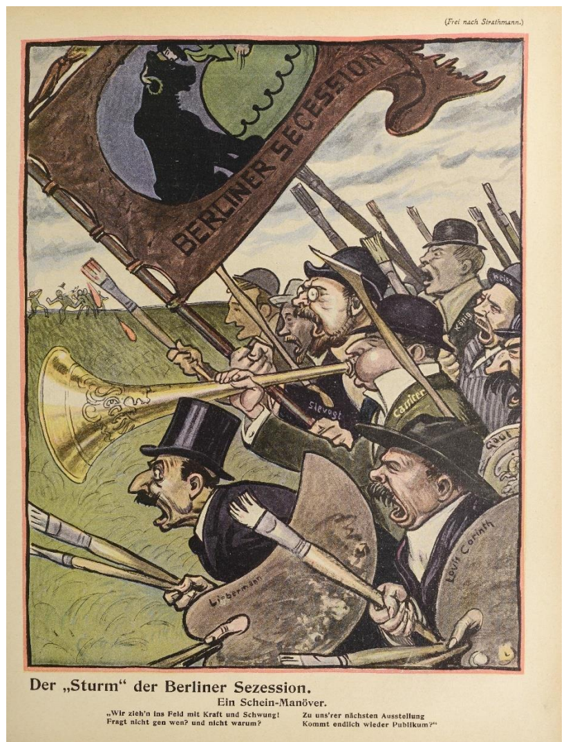
9 - Der „Sturm“ der Berliner Sezession. Ein Schein-Manöver, 1910, Reproduktion, aus: Lustige Blätter , 1910, Nr. 9, S. 9