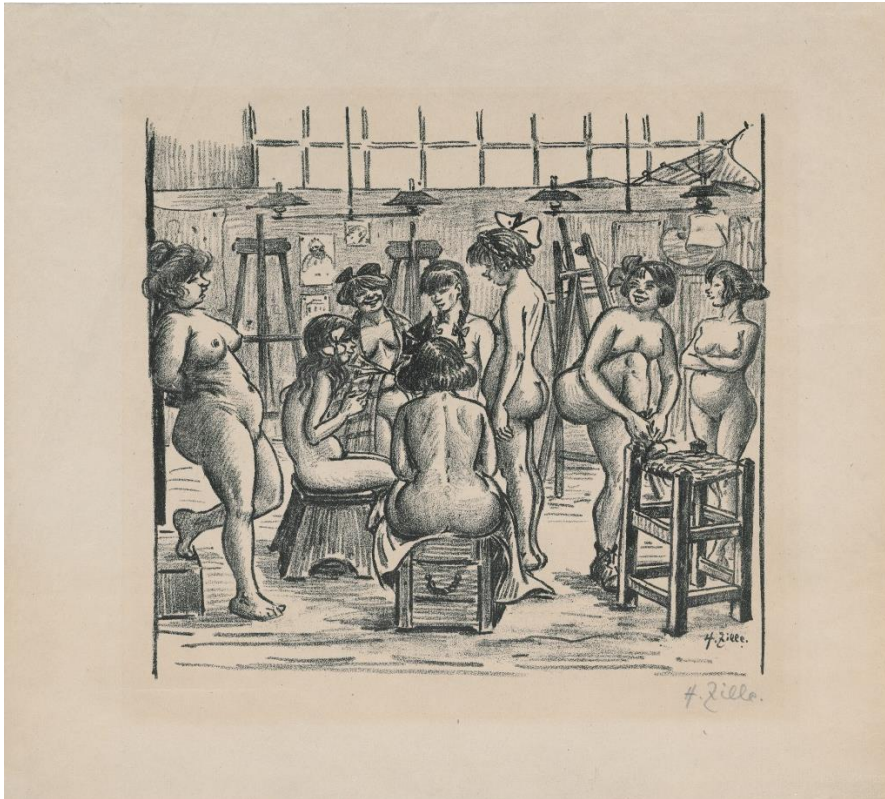
4 – Heinrich Zille, Modellpause , 1923-1928, Lithografie auf Velin, Stiftung Stadtmuseum Berlin