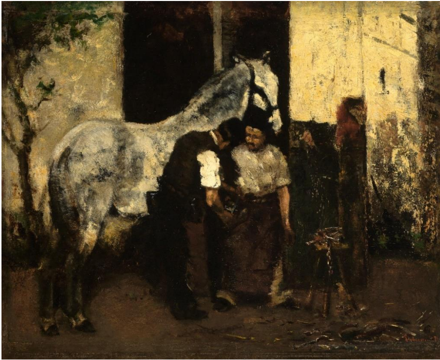
2 – Max Liebermann, Beim Hufschmied , 1874, Öl auf Holz, Staatliche Kunsthalle Karlsruhe