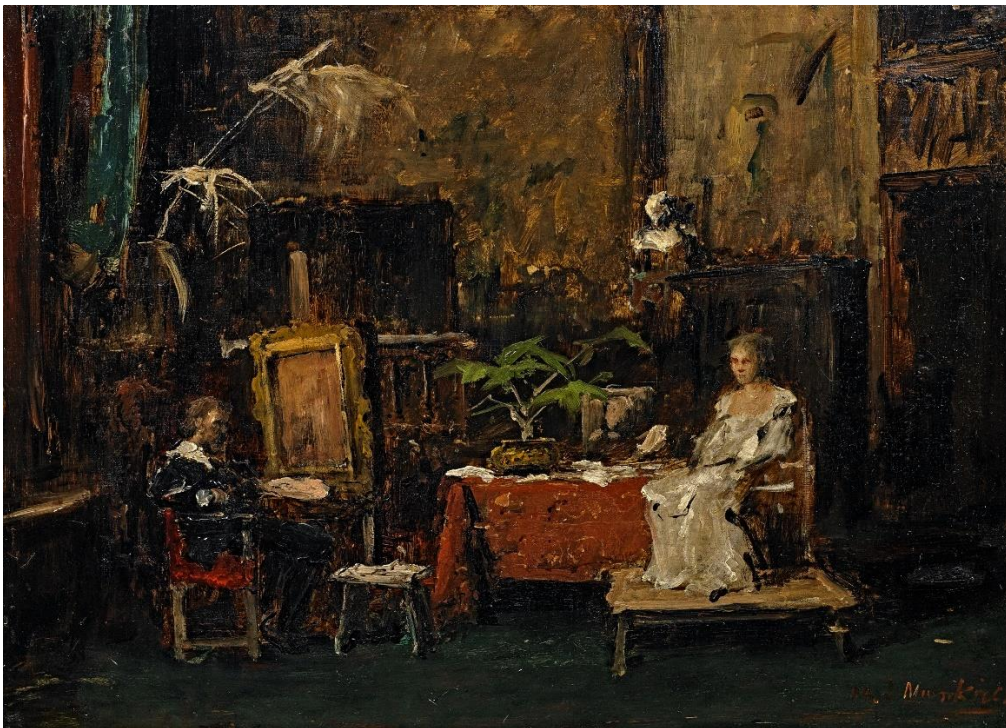
7 – Mihály Munkácsy, Im Maleratelier , o. D., Öl auf Holz, Sammlung von Imre Pakh