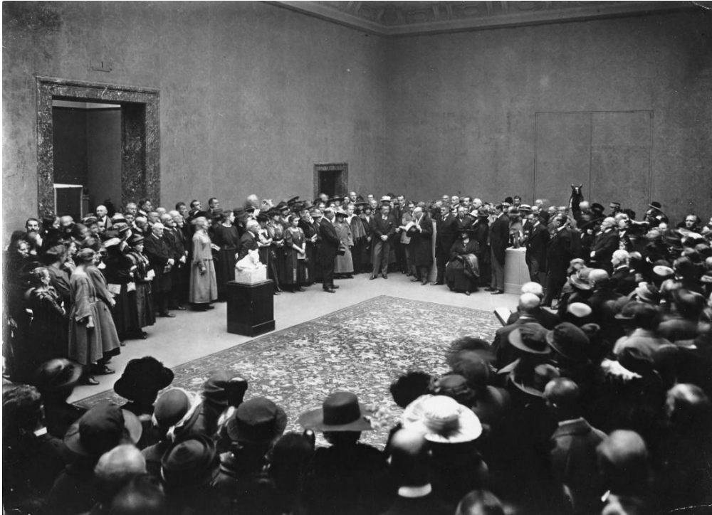
6 – Max Liebermann in der Akademie der Künste bei seiner Rede für die August Gaul Gedächtnisausstellung, 1922