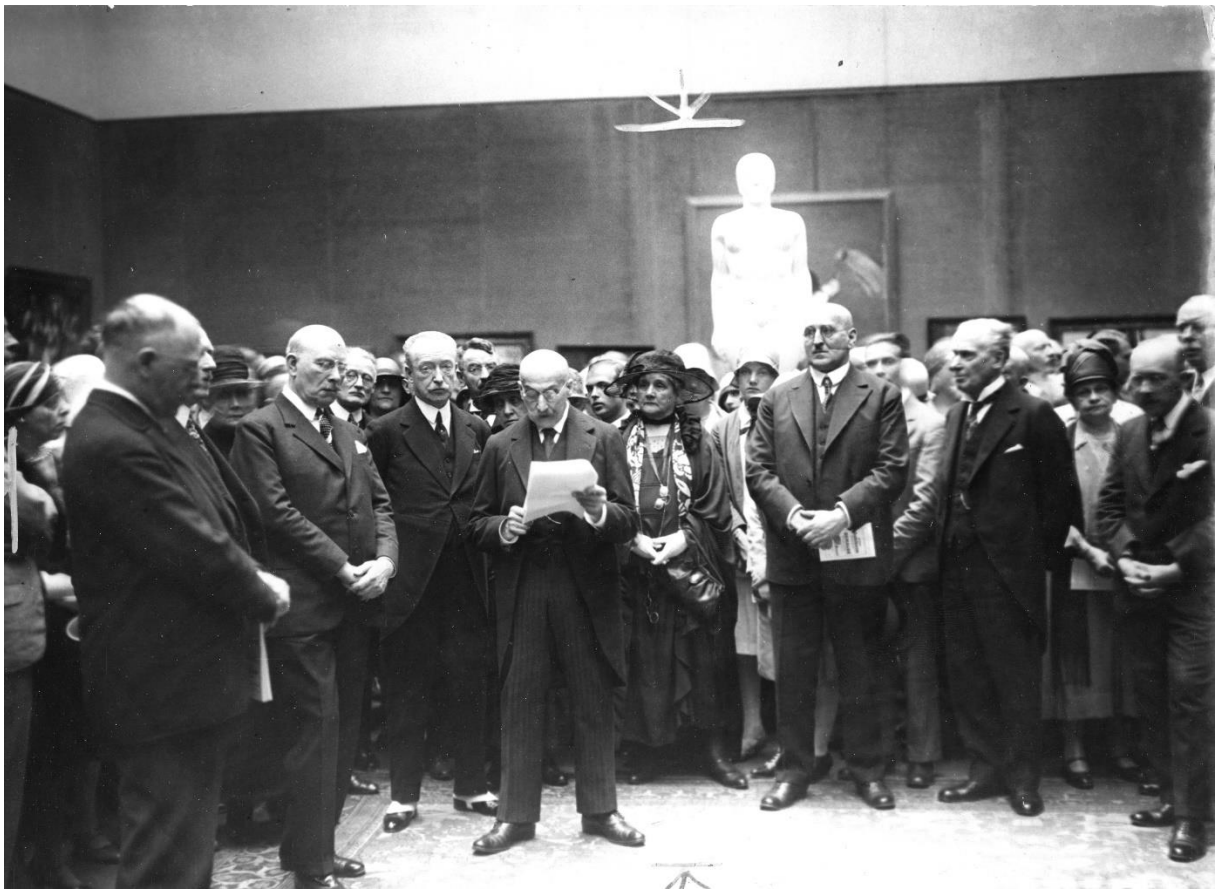
1 – Eröffnung der Frühjahrsausstellung in der Akademie der Künste, 1921