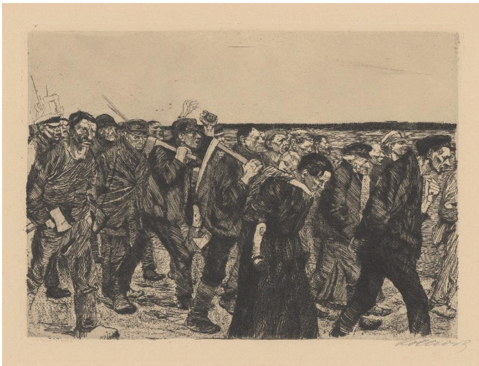
5 – Käthe Kollwitz, Weberzug , aus dem Zyklus Ein Weberaufstand , 1893-1897, Blatt 4, Radierung, Kunstsammlung der Akademie der Künste, Berlin