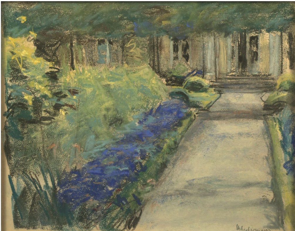
4 – Max Liebermann, Vordergarten nach Osten , 1924, Pastell, Privatbesitz