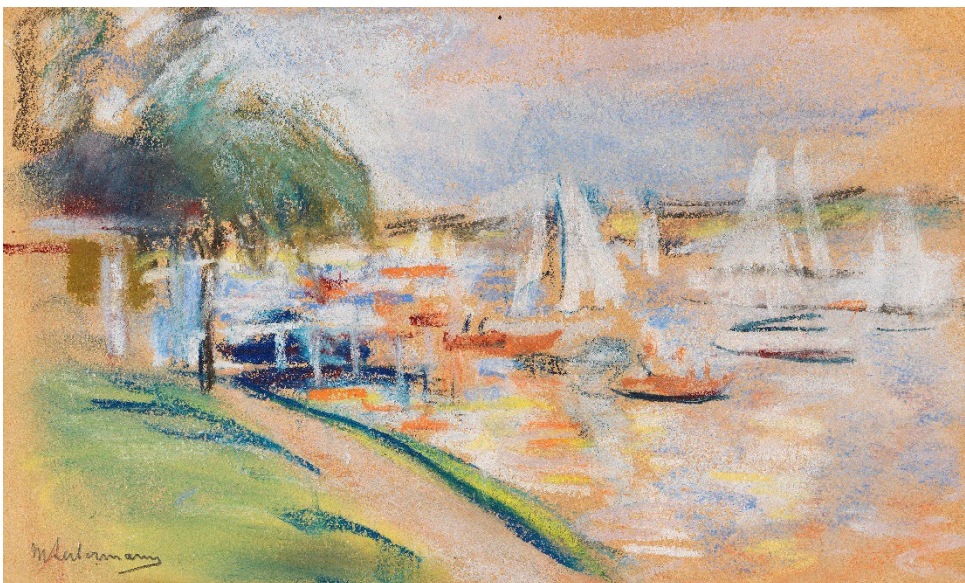
2 – Max Liebermann, Wannsee , 1925, Pastell, Privatbesitz