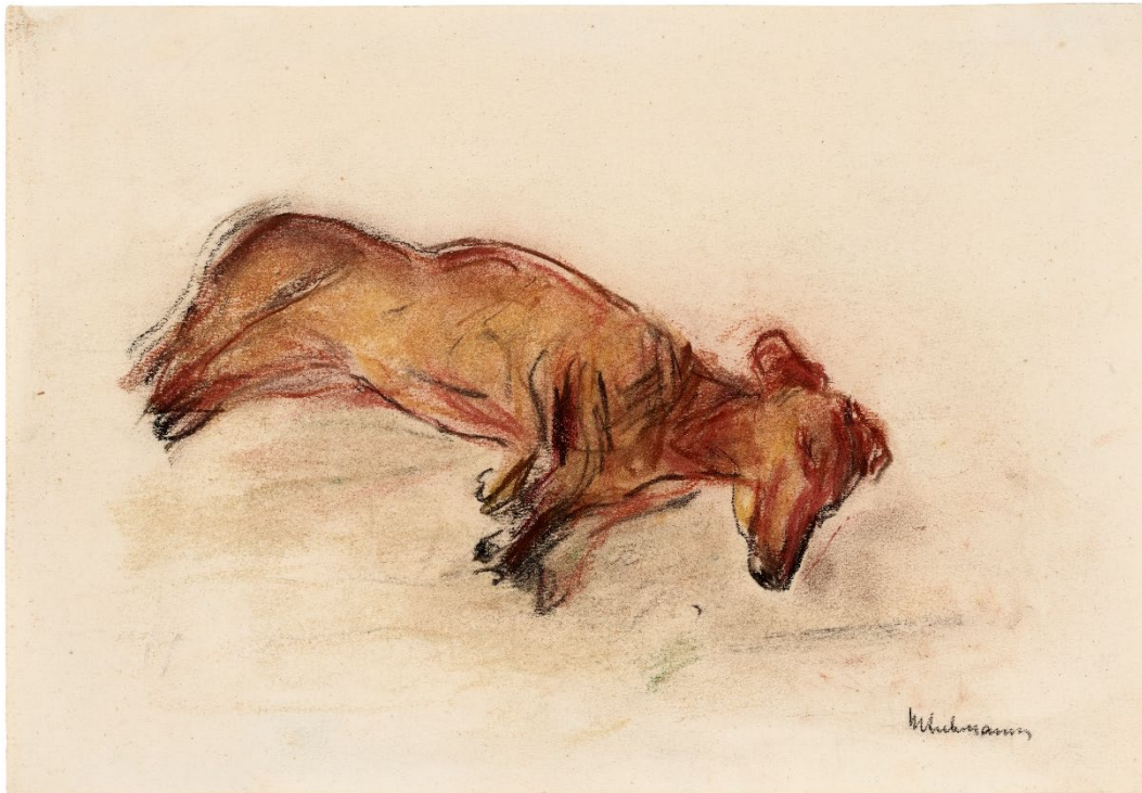
5 – Max Liebermann, Schlafender Dackel , undatiert, Pastell auf Papier, Sammlung Mathis + Roland, Berlin