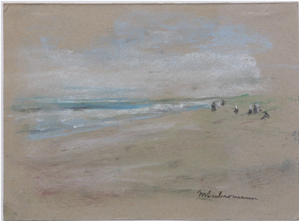
7 – Max Liebermann, Weite Strandlandschaft mit einzelnen Staffagefiguren , um 1890, Pastell auf grauem Papier, Privatbesitz