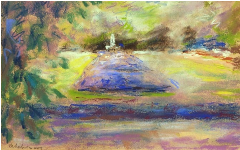
1 – Max Liebermann, Blumenbeet im Wannseegarten mit Blick auf den Fischotterbrunnen , 1919, Pastell auf Velin, Privatbesitz